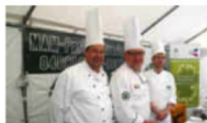
Die Köche der Westküste kreierten Spezialitäten aus Weißfisch.